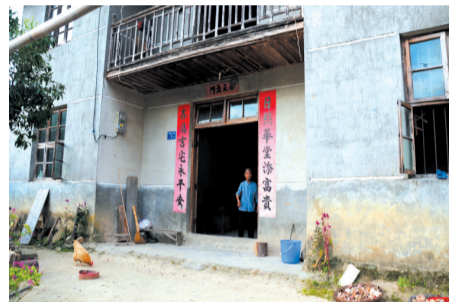
▲村中留守的老人對山外來客好奇又熱情。