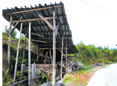
▲在上乾，榨笋房和谷倉一樣是農戶必備的添置物，一個用來榨笋，一個用來囤放糧食。